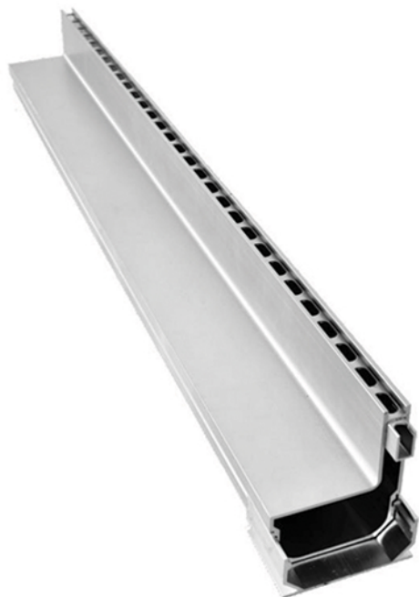
Standaard afmetingen Alu Side-Drain